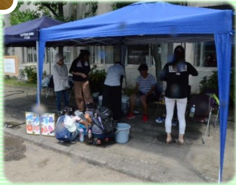
サイエンス フェスティバル in 境川 ペットボトルロケット

PTA執行部は、それぞれ担当の活動のほか、サイエンスフェスティバルなどの地域行事、学校行事の交通整理などの学校運営を陰で支える活動も行っています。