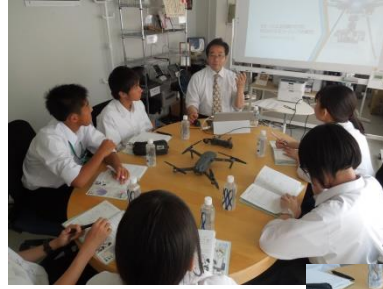
カミエンス・テクノロジー(株)