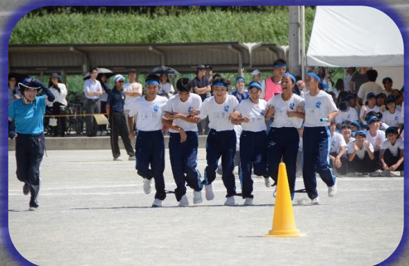
スクラムダッシュ!!