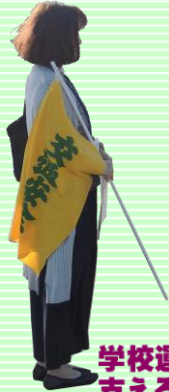
学校運営を 支える活動