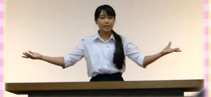
【中学生英語弁論大会】