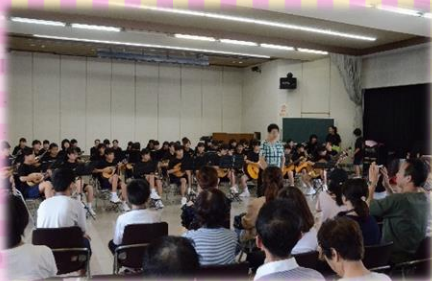
【ギター・マンドリン部】