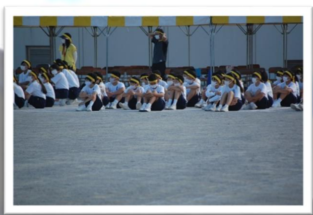
自ら気付き、動ける事。大切に大事な姿。