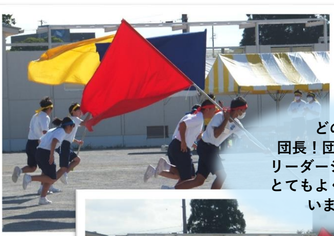
どの団も 団長！団リーダー！ リーダーシップがよく とてもよくまとまって いました！